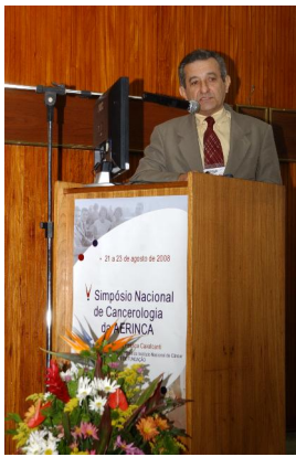
Em 2008 – Simpósio Aerinca